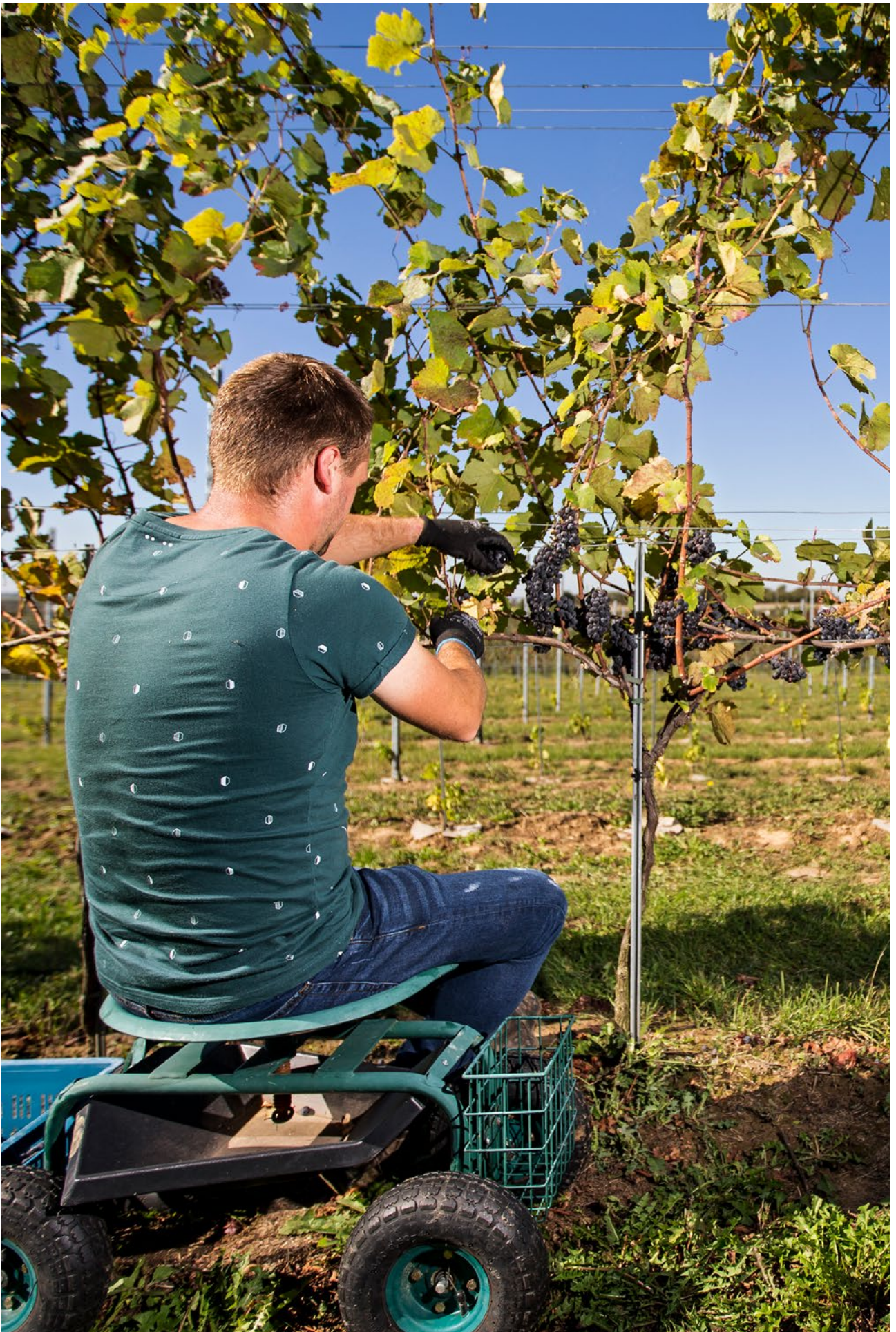
2022 - Limburg, drijfveer voor morgen