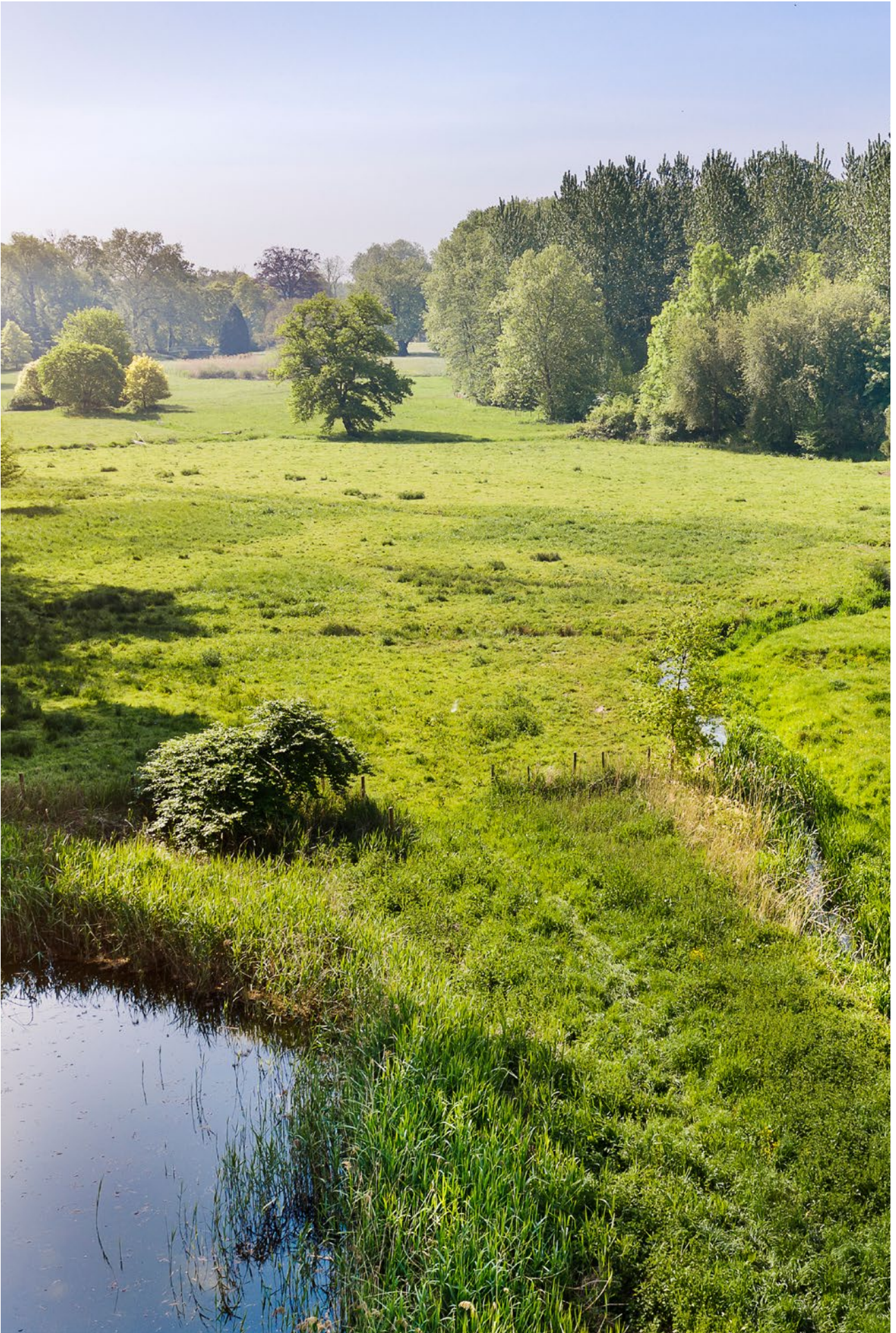
2022 - Limburg, drijfveer voor morgen