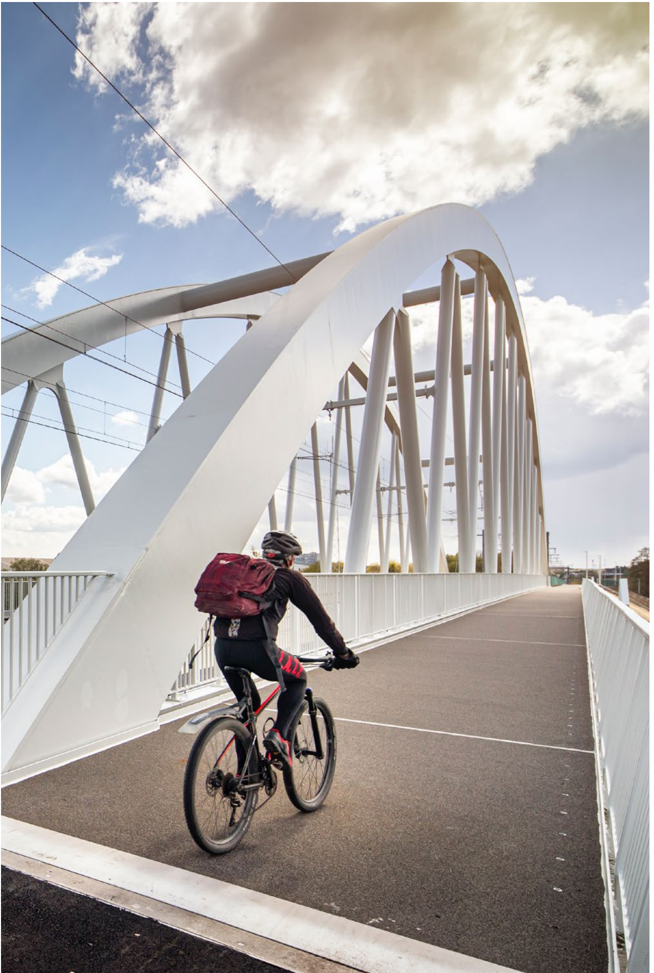
2022 - Limburg, drijfveer voor morgen